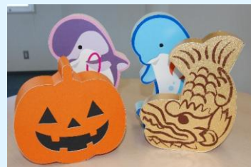
スタイルボックス

ボトルネックの作業時間を短縮できる生産体制を構築するため、経営革新計画の策定に取り組み「ものづくり補助金」に採択されました。結果自社開発の量産機械に加えカッティングマシンの導入によって、大幅な納期短縮とコストダウンにつながり、多くの注文を受けられる体制が整いました。