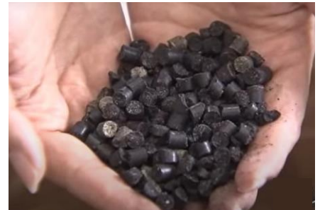
エコな肥料「バイオ炭」