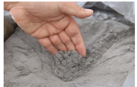
多様な用途「もみ殻シリカ」

今回の事業所訪問は、「もみ殻」を産業廃棄物から高付加価値商品へと新分野進出に取り組んでいる「有限会社 国定農産」さんに伺います。